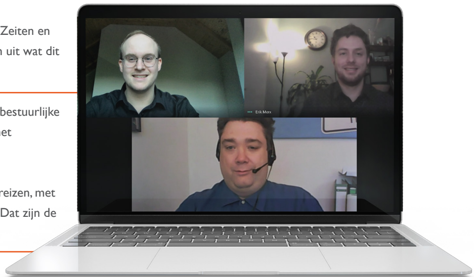
Grensoverschrijdend onderzoek: digitaal overleg

JADE HOCHSCHULE Wilhelmshaven Oldenburg Elsfleth