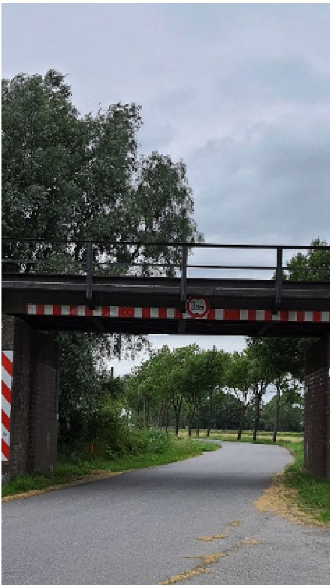
De Hilkenborger Straße-brug wordt vervangen door een stalen bovenbouw en nieuwe landhoofden

De huidige plannen zijn om de Hilkenborger Straße- en Wymeerer Sieltief-viaducten volledig te renoveren. Er komen nieuwe landhoofden (steunpunten van een brug) en een geheel nieuwe staalconstructie. Ook de landhoofden en bovenbouw van de Bunder Katzentief-brug worden vernieuwd. Omdat de Bunder Katzentief-brug waarschijnlijk als laatste van de vijf bruggen wordt aangepast, is de planning hiervoor nog niet geheel rond.