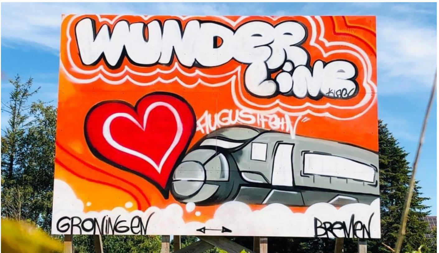
'Het hart van de Wunderline'